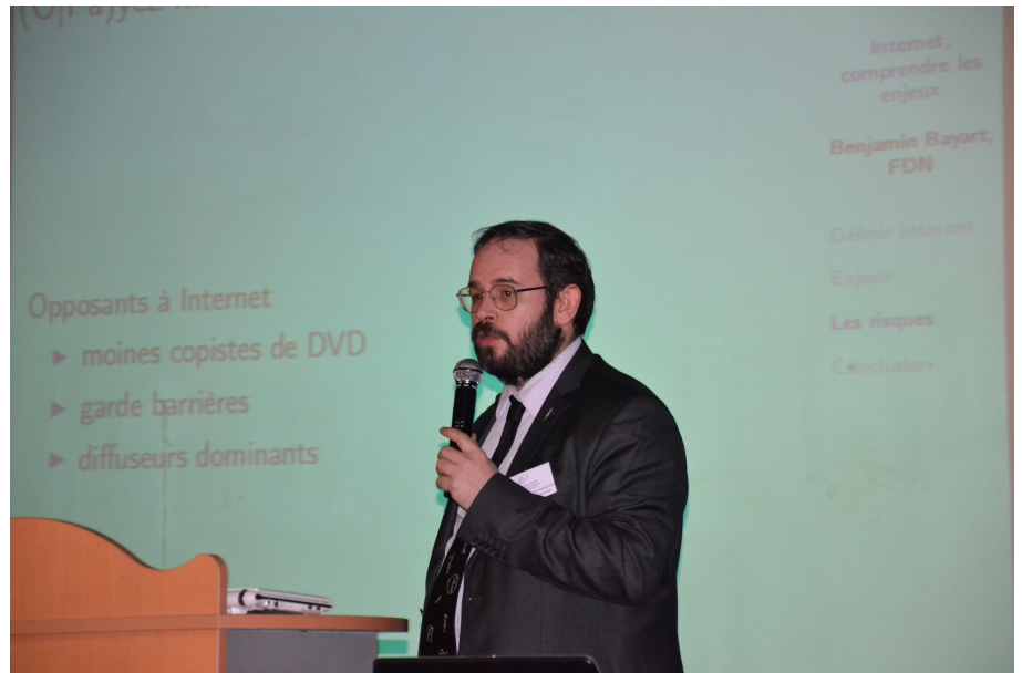
Illustration 3: Benjamin Bayart

Benjamin Bayart, expert en télécommunications, nous livrera, comme en 2011, une conférence sur cet internet qu'il tient à préserver face à la censure et à la centralisation voulue par les grandes entreprises de l'internet. Il fera aussi un point sur l'enjeu d'internet dans les révolutions arabes de 2011, dans le but de mieux faire comprendre pourquoi internet est né en 1965, dans un contexte de guerre froide.