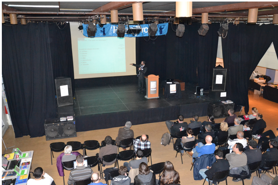
Illustration 1: La Journée de l'Informatique Libre 2011