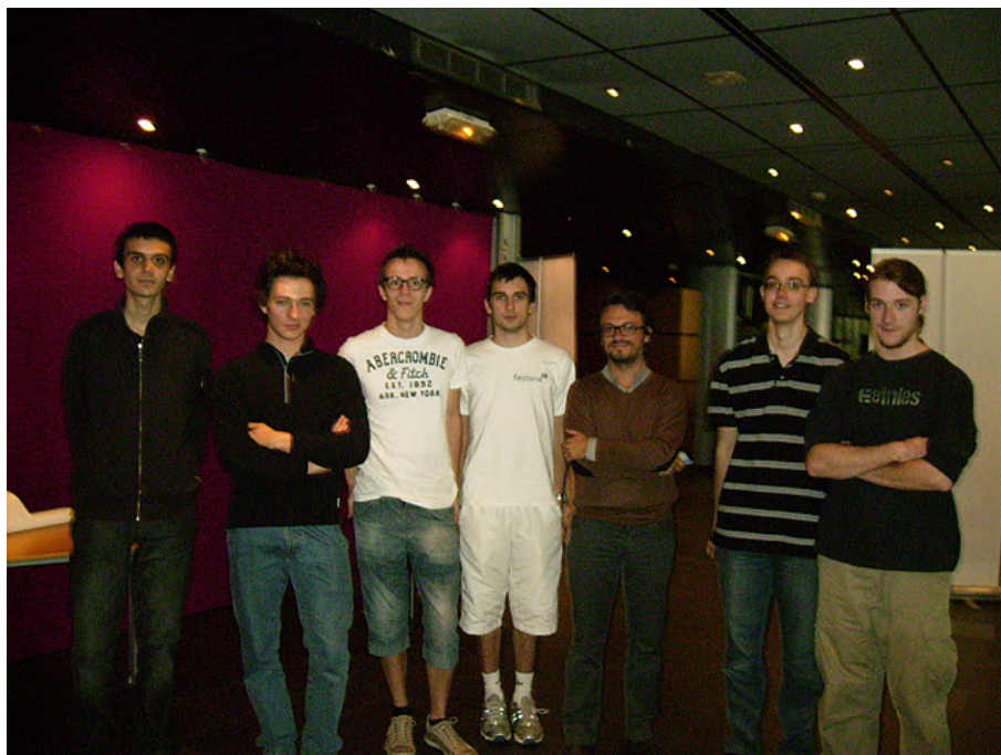
Illustration 5: L'équipe d'organisation de la JIL

Ce groupe de travail issu du pôle technique s'occupera d'afficher, au mieux possible, la JIL, tout en prenant soin de la bonne mise en œuvre des méthodes.