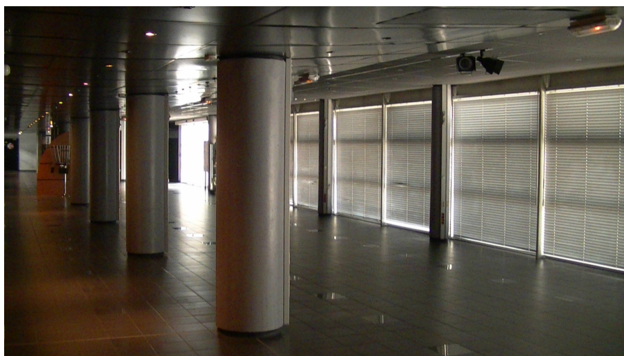
Illustration 9: Lieu où se tiendra l'espace de rencontres

Fort de son réseau de partenaires, La Cantine développera l'espèce de rencontres lors de la Journée.