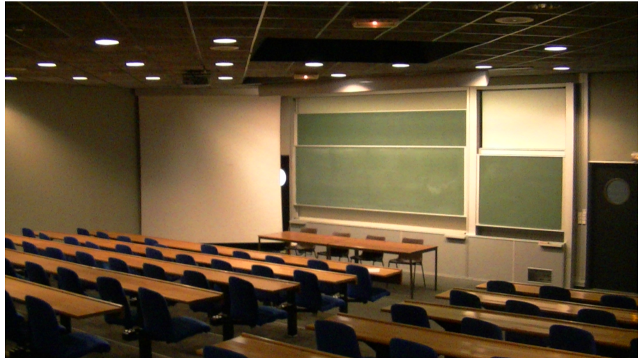
Illustration 10: Amphithéâtre de l'ISEN, où se tiendront les conférences